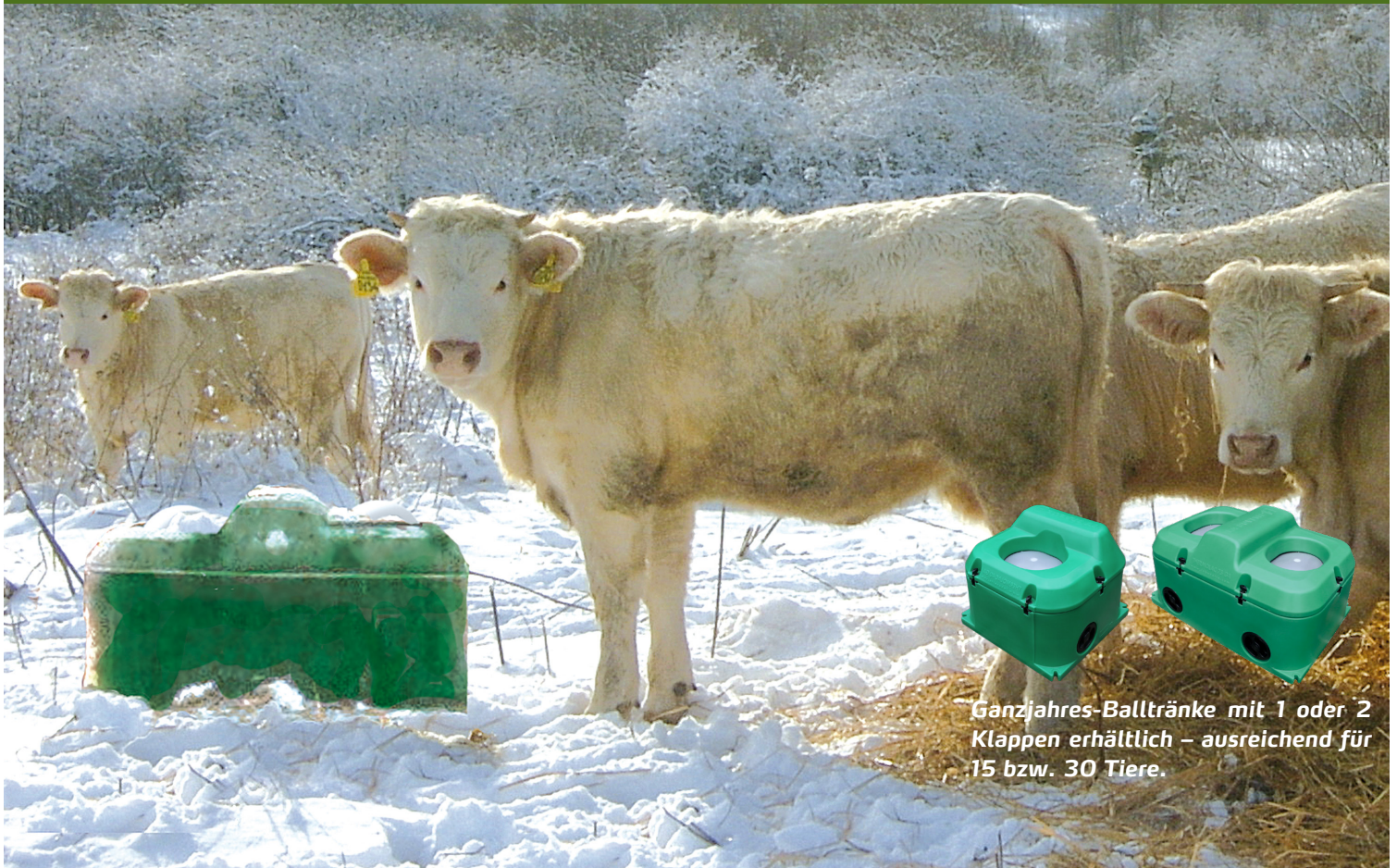
Ganzjahres-Balltränke mit 1 oder 2 Klappen erhältlich – ausreichend für 15 bzw. 30 Tiere.