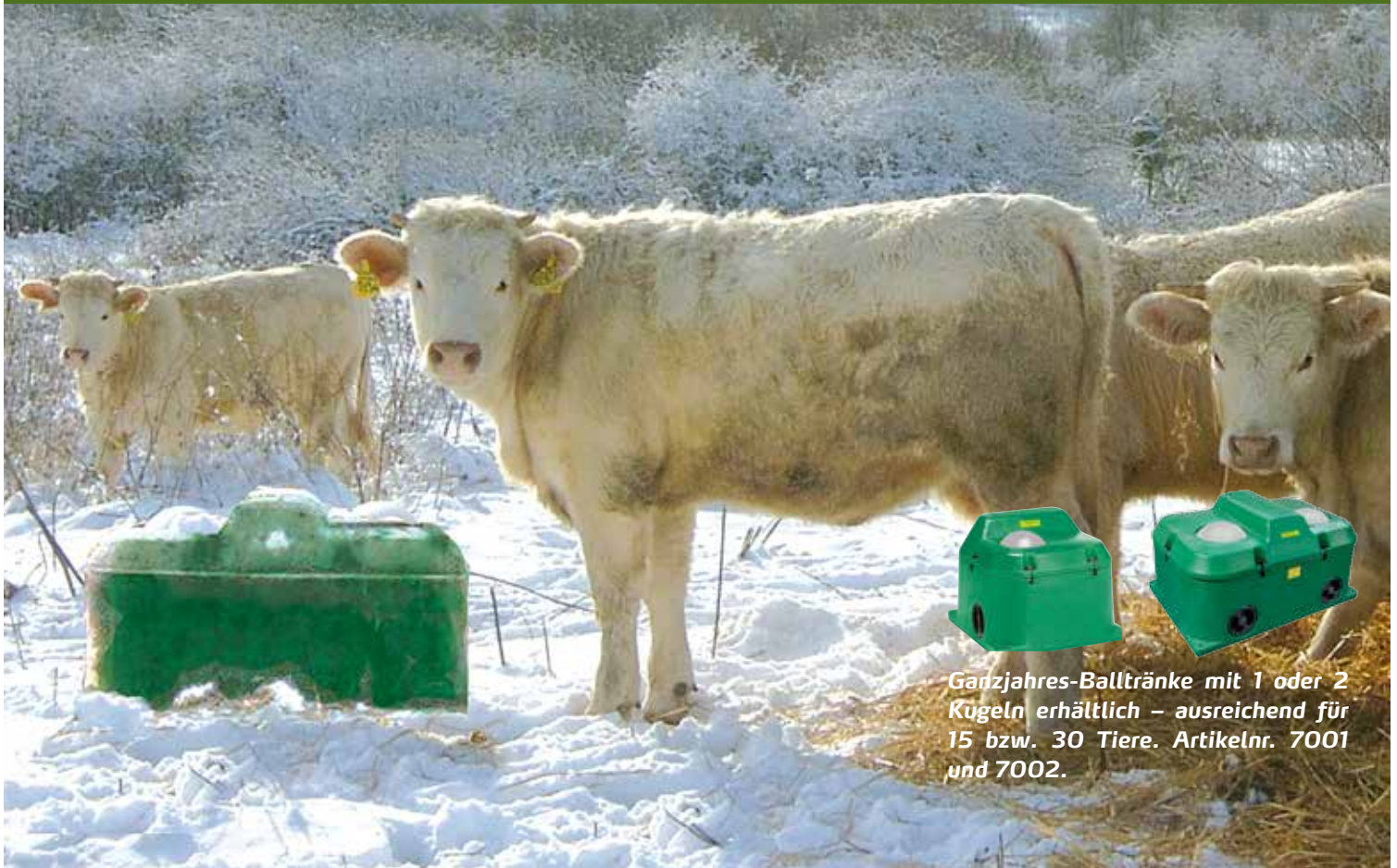
Ganzjahres-Balltränke mit 1 oder 2 Kugeln erhältlich – ausreichend für 15 bzw. 30 Tiere. Artikelnr. 7001 und 7002.